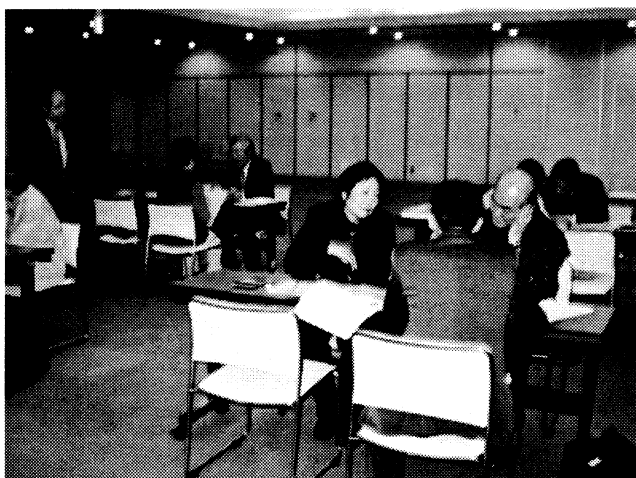
さいたま浦和会場