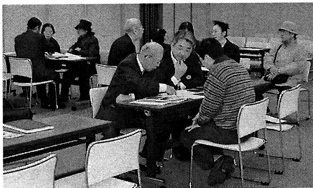
さいたま浦和会場