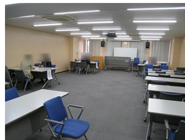
春の無料相談会 上段 さいたま会場・下段 川越会場